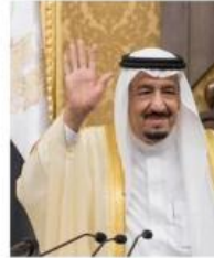
King Salman of Saudi Arabia in Cairo on Sunday. The countries signed at least 15 agreements during the visit, including an oil deal worth $22 billion to Egypt.