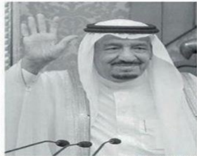
King Salman of Saudi Arabia addressed Egypt's Parliament in Cairo on Sunday. The countries signed at least 55 agreements during the visit, including an oil deal worth $22 billion to Egypt.

King Salman's visit has disrupted life in Cairo for days, exacerbating the city's notorious traffic as he attended meetings at the presidential palace and visited the ancient Al-Masara mosque.