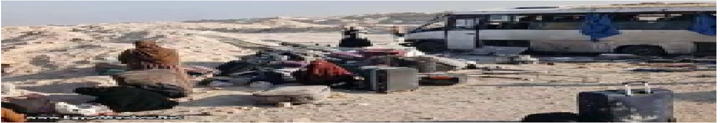
بالصور: إصابة 18 طالبة في حادث أنوبس بطريق الصعيد الحر بالمنيا الخميس 9 أبريل 2026 11:20 م