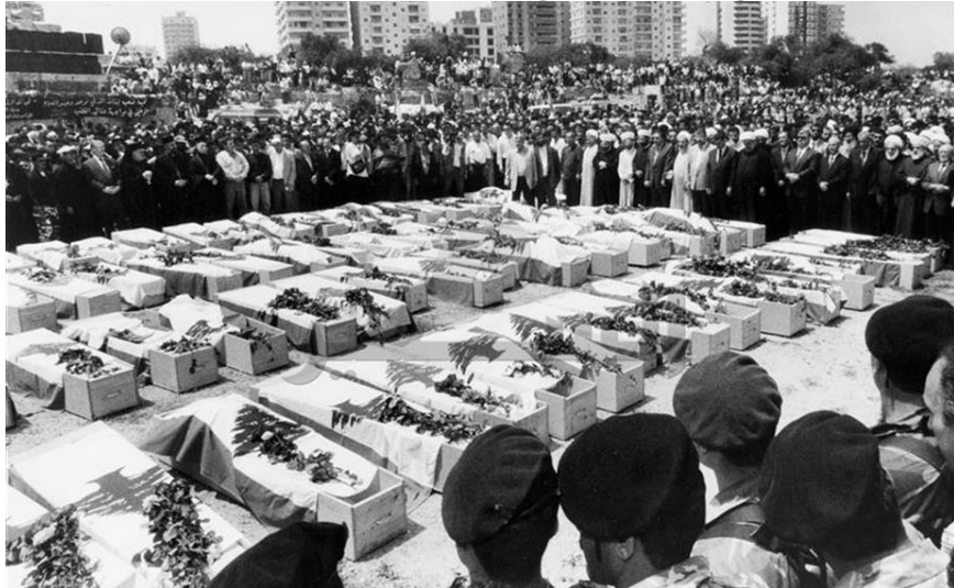
مجزرة قانا 1996

3- قاد بيريز عدوانا عسكريا أطلق عليه اسم "عناقيد الغضب"، قصف فيه مدن لبنان بما فيها العاصمة بيروت في أوائل مايو 1996 ، وتمثلت الوحشية الإسرائيلية في أعنف صورها عندما قصفت القوات الإسرائيلية ملجأ للأمم المتحدة بقانا في الجنوب اللبناني يؤوي مدنيين أكثرهم من الأطفال والنساء والشيخوخ مما أسفر عن جرح ومقتل المئات.